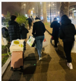
Association caritative internationale Les Lumières du Monde

Nous tenons également à remercier celles et ceux qui ont pensé aux plus jeunes en nous apportant des cadeaux destinés aux enfants que nous avons croisés au hasard des rues.