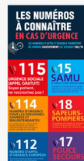
Association caritative internationale Les Lumières du Monde