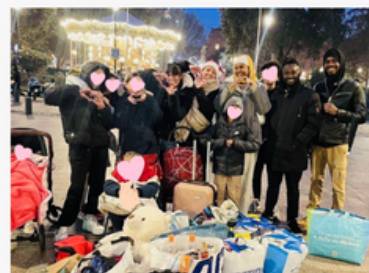
Notre équipe de bénévoles 30/12/2024

Nous essayons d'apaiser à notre manière le sentiment de solitude et d'isolement, le temps d'un instant.