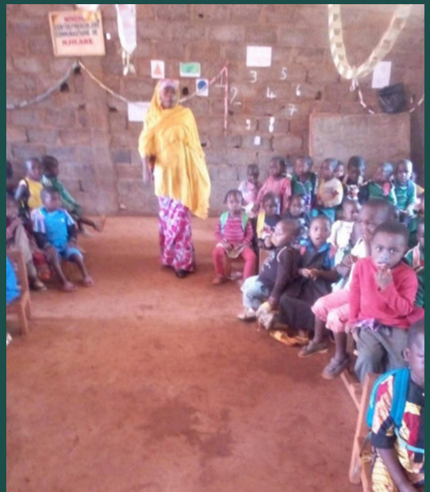
Elèves et enseignante de l'école de Njilaré

Monsieur le Président Comité de gestion du centre communautaire de Njilaré Cameroun