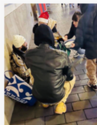
Association caritative internationale Les Lumières du Monde

Père de trois petites filles, il se rend dans la rue pour tenter de récupérer un peu d'argent et subvenir aux besoins de sa famille.