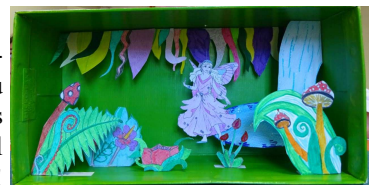
Art en boîte

Boîtes à rêves, ambiances amérindiennes, mosaïque, compositions florales, découverte du rock, danses latines... expression corporelle avec des objets ou création contemporaine à partir des gestes du quotidien... Vous souhaitez découvrir de nouvelles activités ou tout simplement cherchez des idées pour divertir vos enfants, n'hésitez pas à vous diriger vers la nouvelle page facebook du Foyer Rural de Pompertuzat ou bien à consulter régulièrement les panneaux lumineux installés dans le village ! Vous y trouverez certainement votre bonheur.