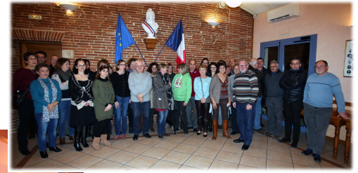
Les vœux aux forces vives de la commune