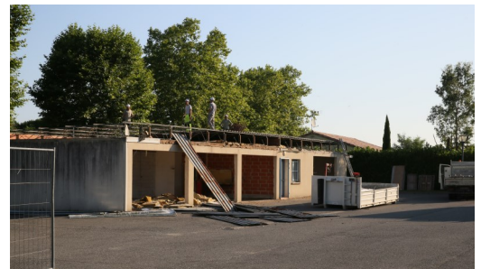
La démolition des anciens ateliers municipaux

Autre chantier important qui a débuté, celui de la maison des associations. Les anciens ateliers municipaux ont été démolis. Les accès à l'arrière de la salle des fêtes et ceux de la salle Garoche ont été détruits. Ces travaux préliminaires entrent dans le cadre de la construction de la nouvelle structure dédiée aux associations communales, à la mise en conformité des accès de la salle des fêtes aux personnes à mobilité réduite, à la construction de locaux de stockage et de loges en arrière scène et au changement des modes de chauffage de la salle des fêtes et de la salle Garoche. Ils pourront occasionner quelques gênes aux Pompertuziens, par la suppression du parking attenant à la salle des fêtes ou la restriction de l'occupation de la salle Garoche. Les travaux devraient être terminés en mai 2019.