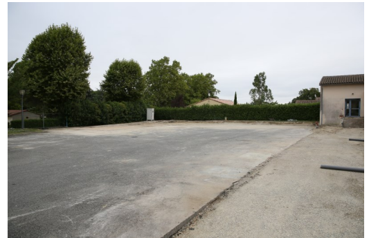
L'emplacement des futurs locaux associatifs

Samedi 8 septembre de 9h à 12h et de 15h à 18h