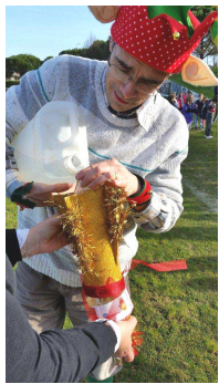
Le délicat chargement en ergol

Comment concilier l'écologie, la science et le rêve. C'est la dure équation qu'ont réussie à résoudre les animateurs de l'ALAE, lors d'une expérience avec les enfants des écoles. Avant les vacances, ils ont organisé l'expédition d'un courrier exceptionnel de confirmation des vœux au Père Noël. Peut-être du fait de la proximité avec le Centre Spatial de Toulouse, ils avaient choisi comme mode de transport : une fusée... à eau, COP 21 oblige. Regroupés sur le terrain de foot jouxtant l'école, et après un petit jeu de piste permettant de retrouver les éléments de l'engin spatial, les enfants ont pu assister à la mise en orbite de la fusée remplie de messages d'espoir. Un lutin, certainement complice du Père Noël, a assuré le bon déroulement du compte à rebours. Immédiatement, le Père Noël a répondu, en renvoyant la fusée, remplie de cadeaux pour l'école.